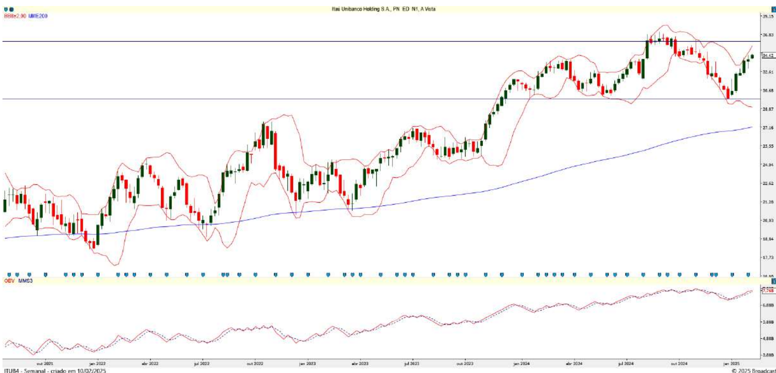
Gráfico 3 – Gráfico semanal de ITUB4