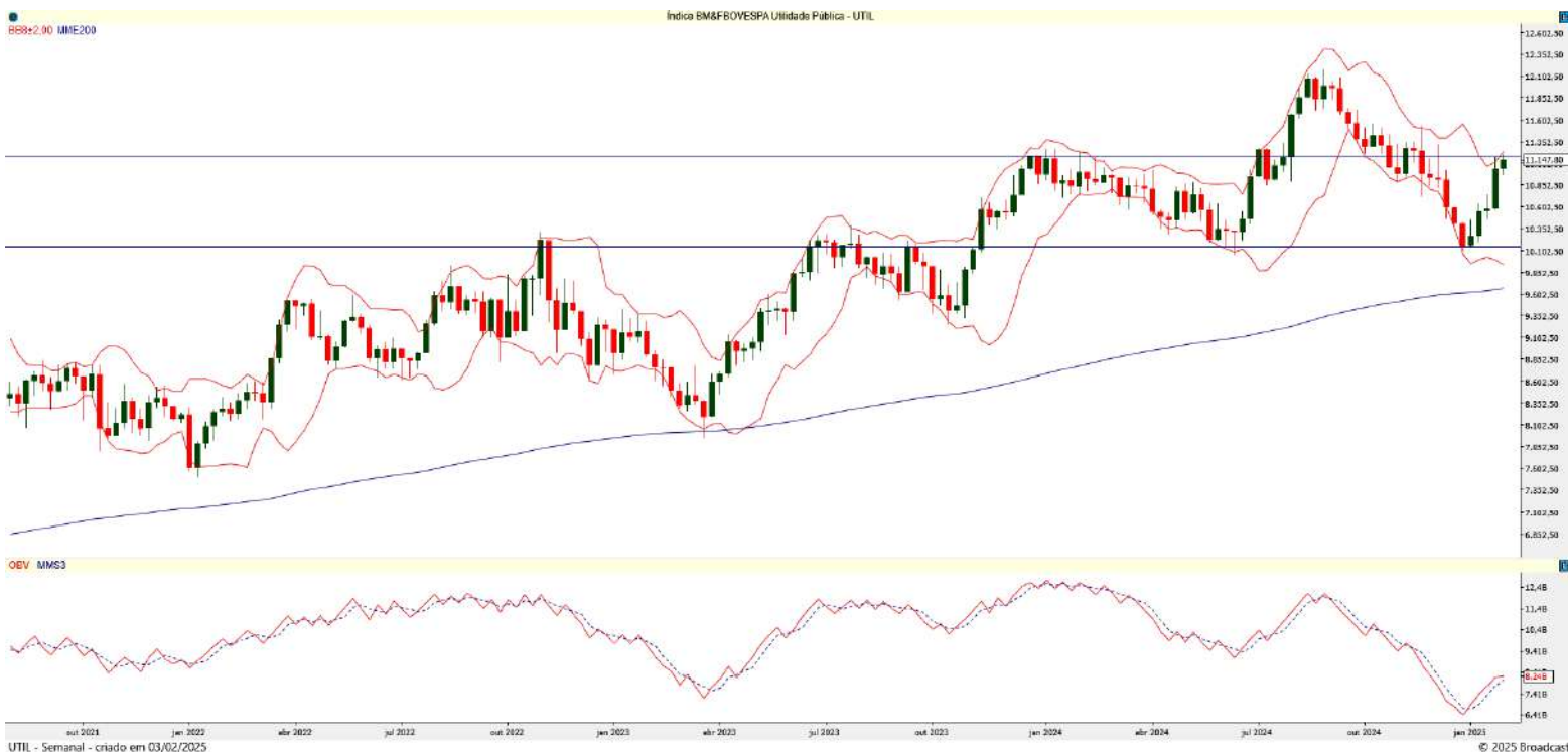
Gráfico 1 – Gráfico semanal do UTIL