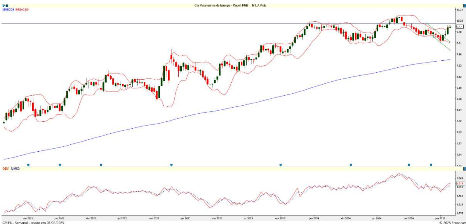
Gráfico 3 – Gráfico semanal de CPLE6