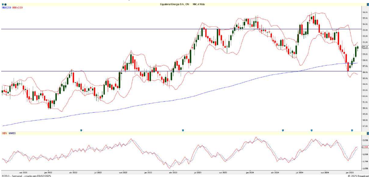
Gráfico 2 – Gráfico semanal de EQTL3