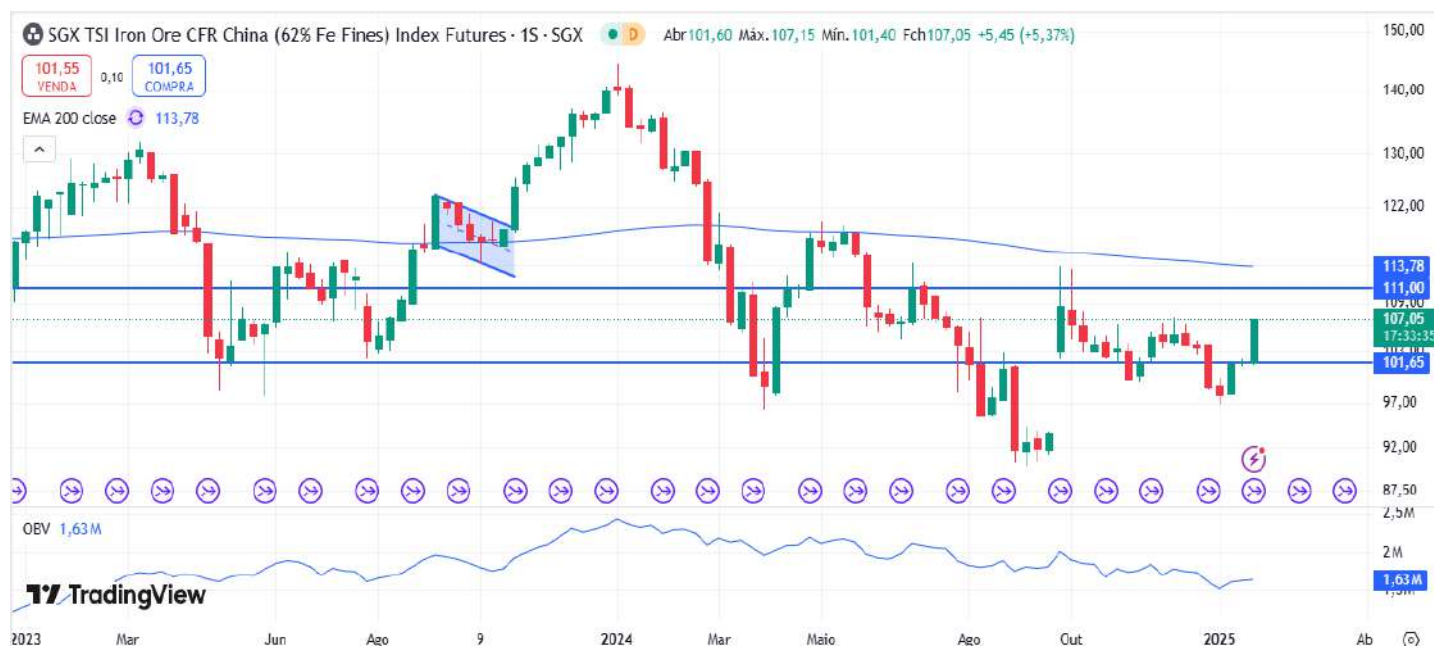
Figura 6 – Gráfico semanal do minério de ferro