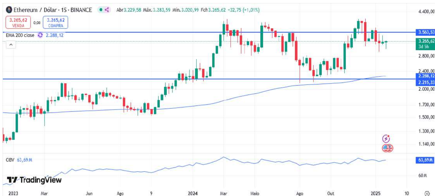
Figura 8 – Gráfico semanal da Ethereum