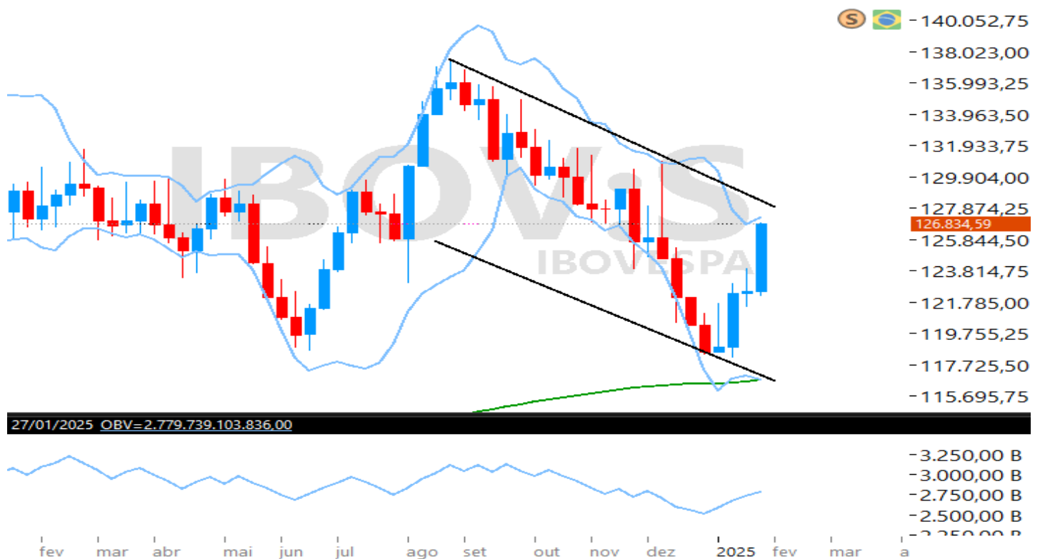
Figura 1 – Gráfico semanal do Ibovespa