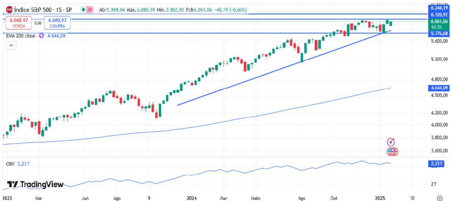
Figura 3 – Gráfico semanal do S&P