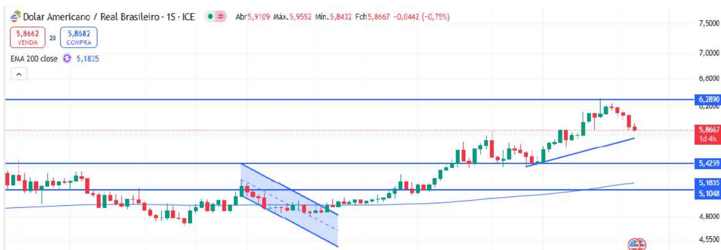
Figura 2 – Gráfico semanal do dólar