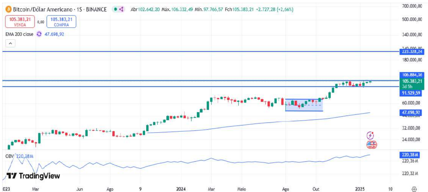
Figura 7 – Gráfico semanal do Bitcoin