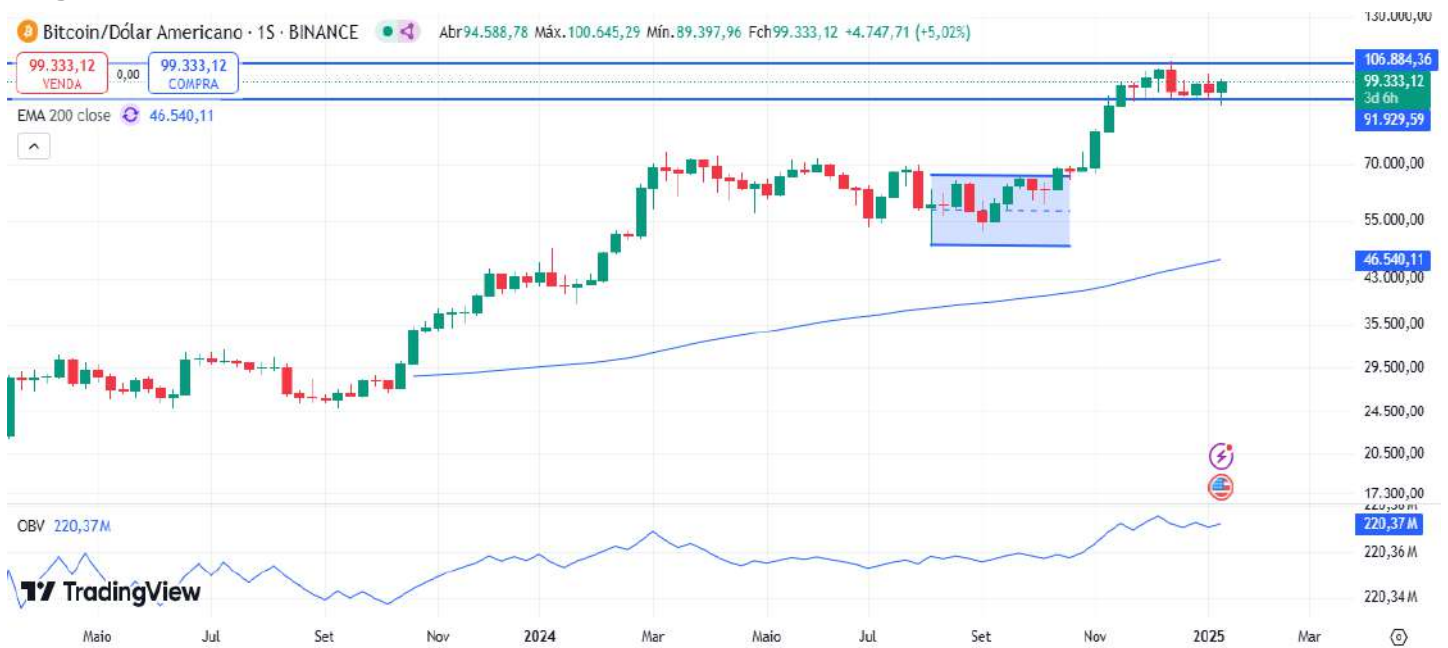
Figura 7 – Gráfico semanal do Bitcoin