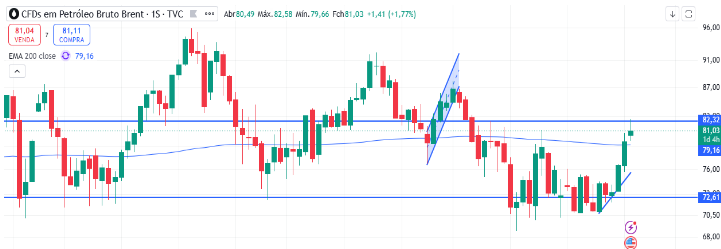
Figura 5 – Gráfico semanal do petróleo Brent