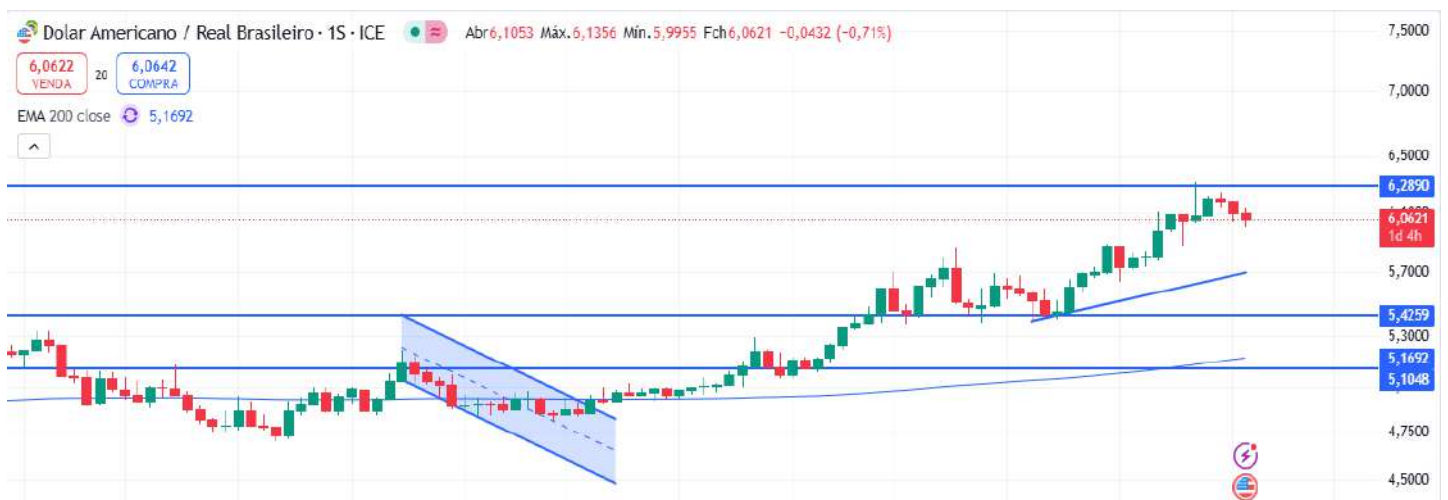
Figura 2 – Gráfico semanal do dólar