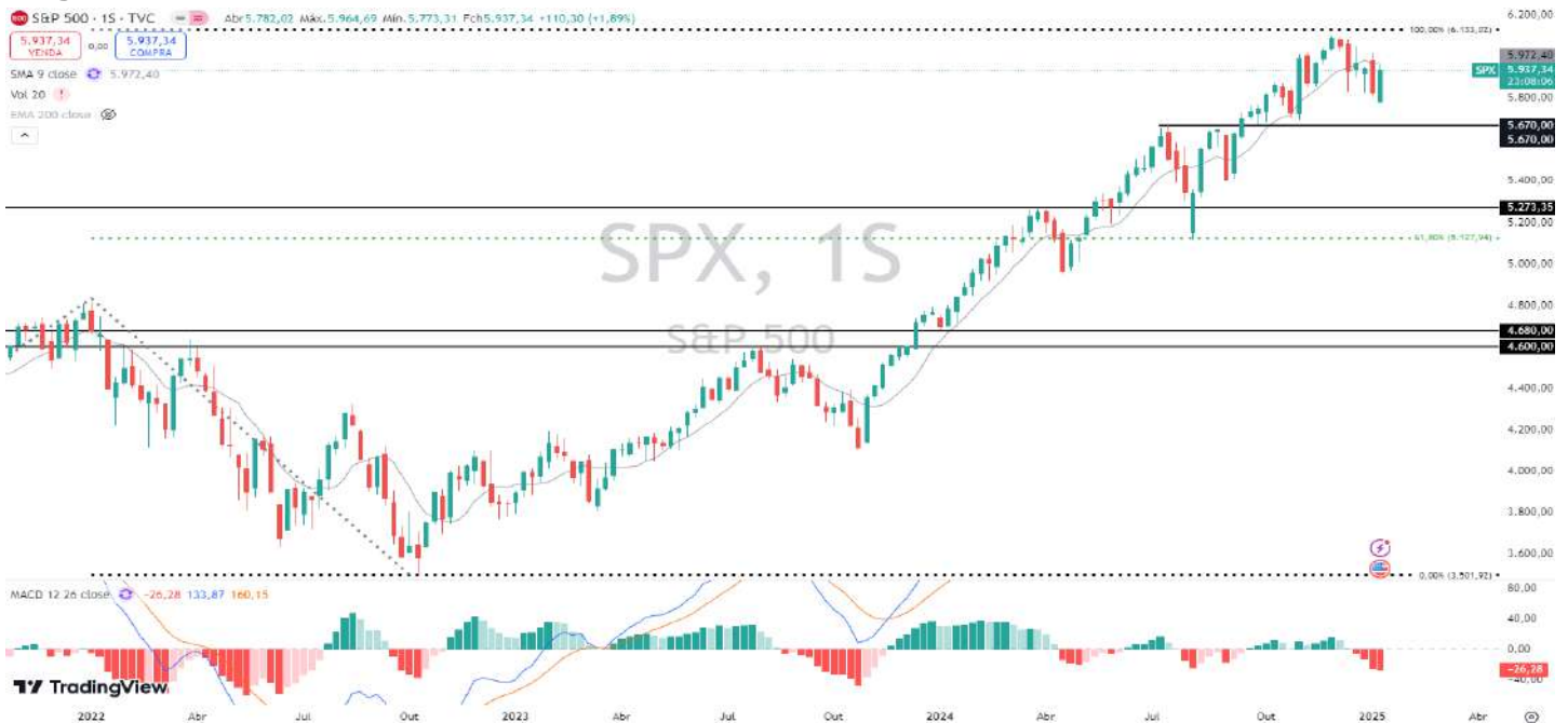
Figura 3 – Gráfico semanal do S&P