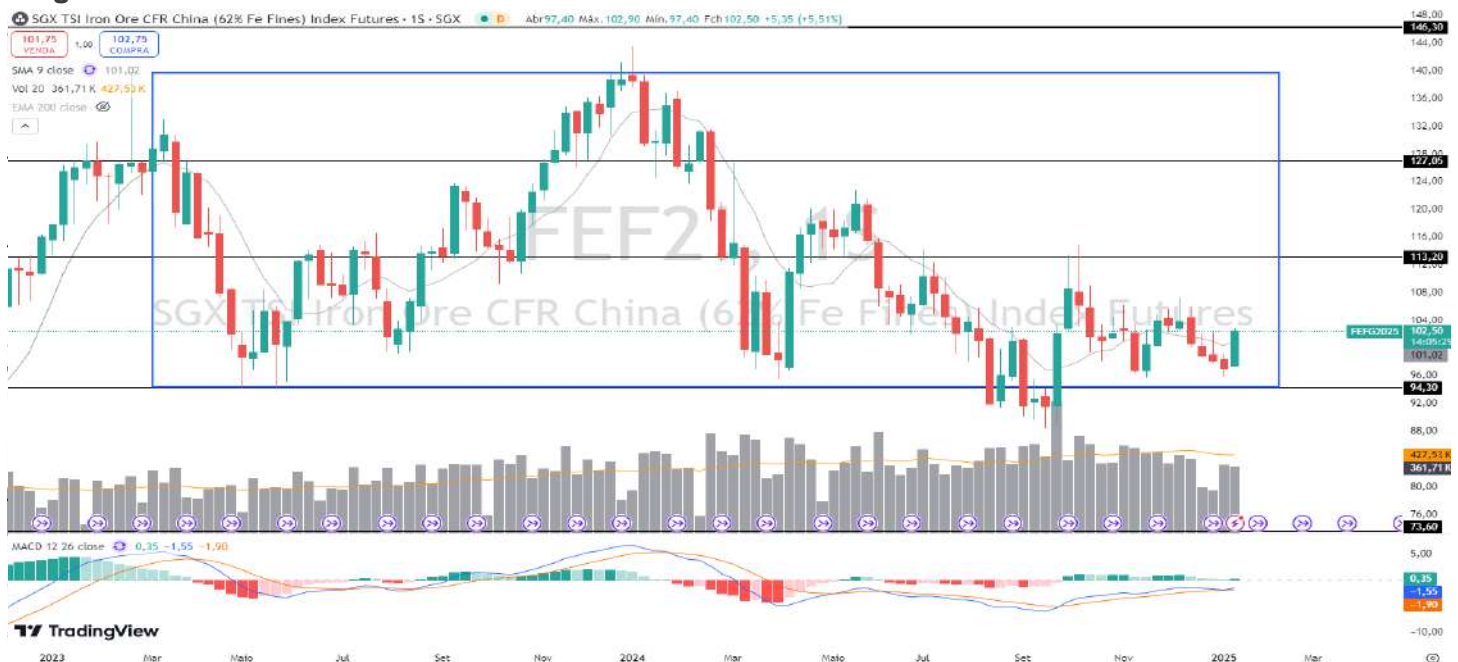
Figura 6 – Gráfico semanal do minério de ferro