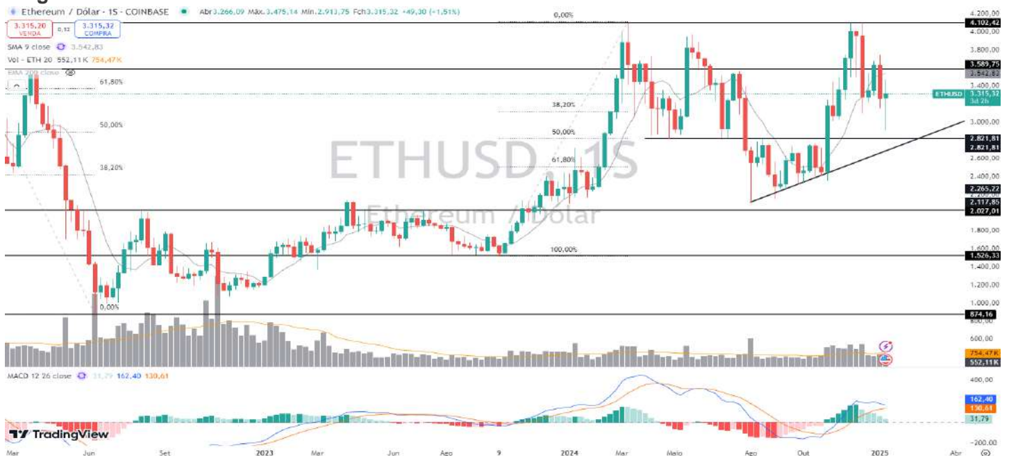
Figura 8 – Gráfico semanal da Ethereum