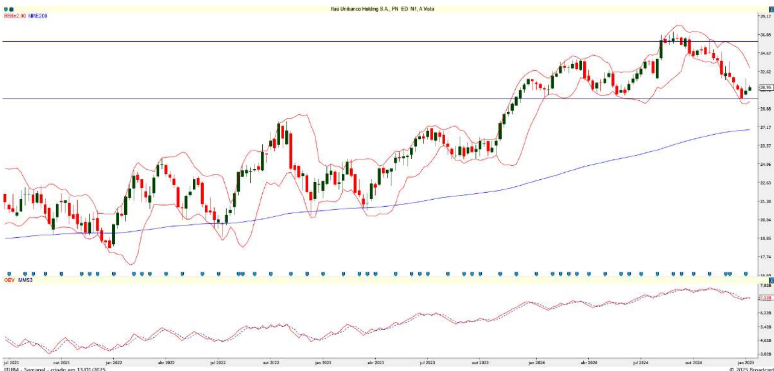
Gráfico 3 – Gráfico semanal de ITUB4