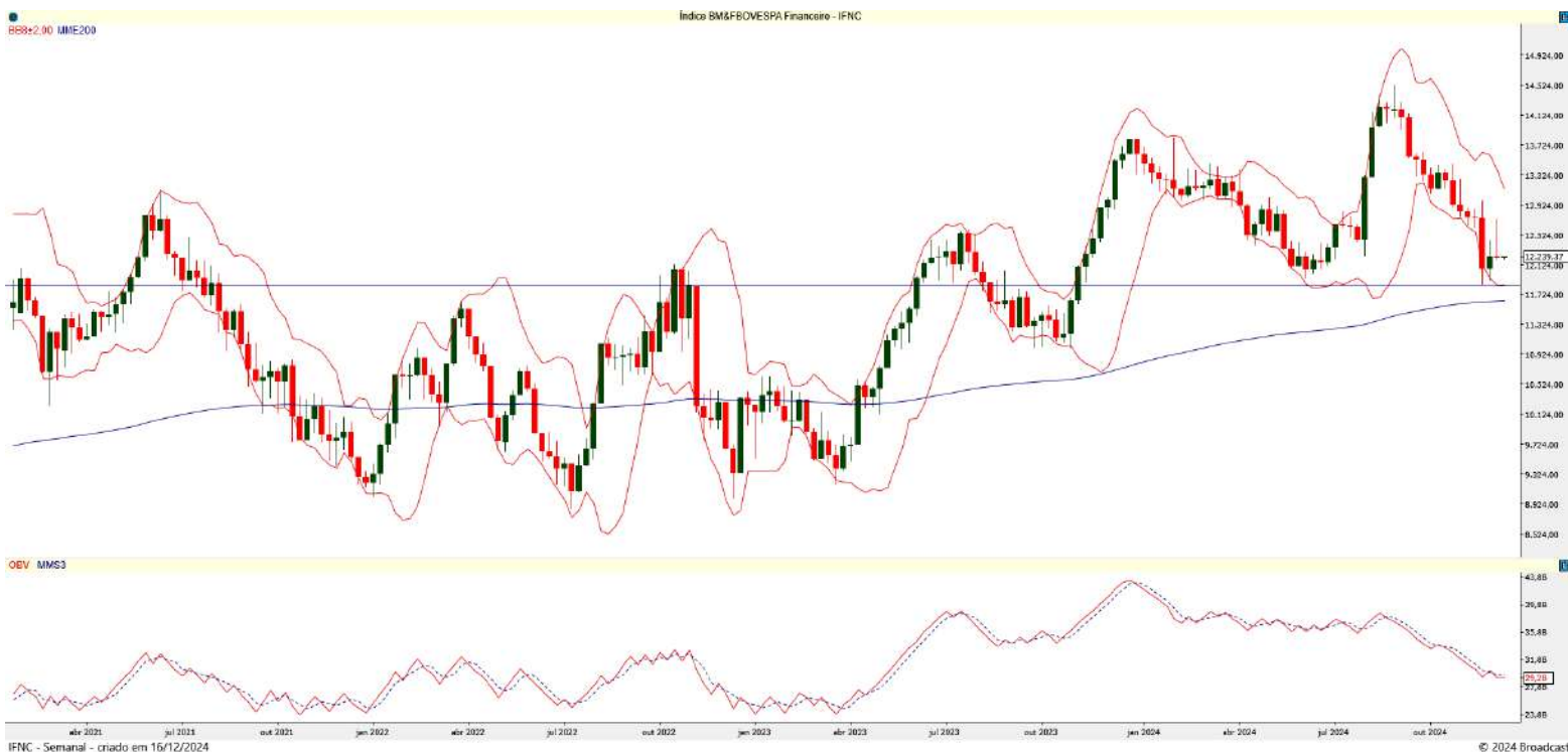
Gráfico 1 – Gráfico semanal do IFNC