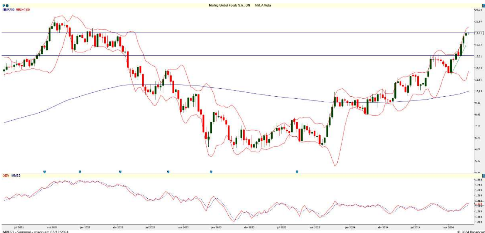
Gráfico 3 – Gráfico semanal de MRFG3