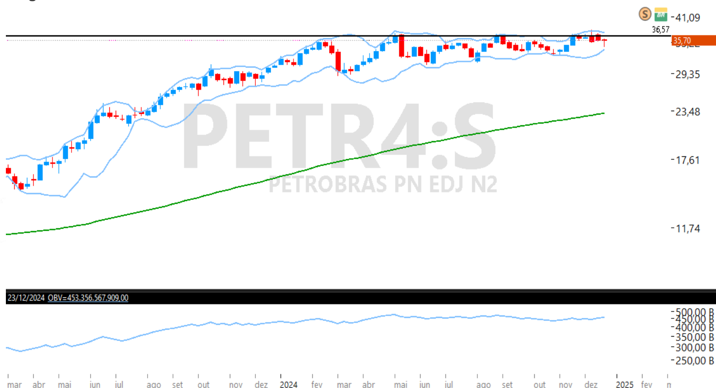
Figura – Gráfico semanal de PETR4