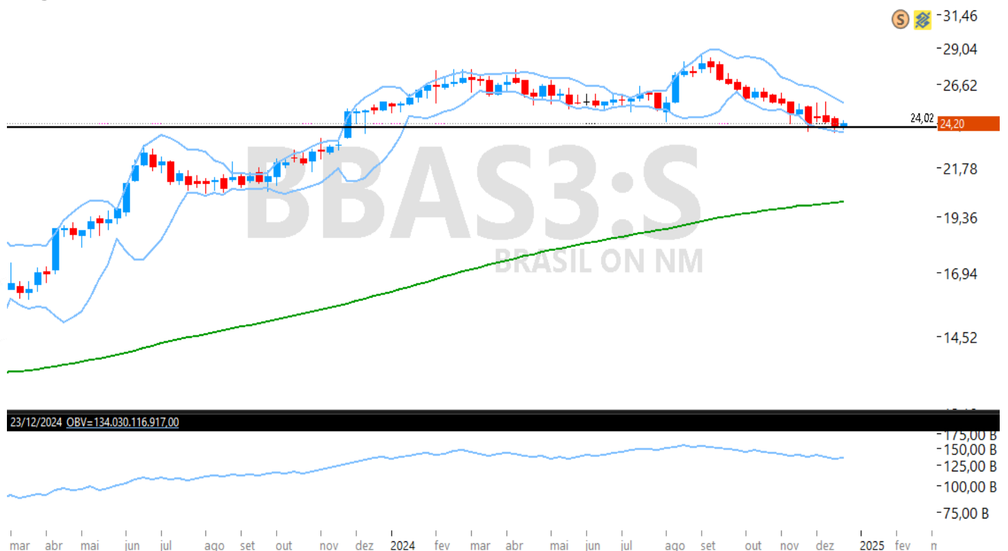
Figura – Gráfico semanal de BBAS3