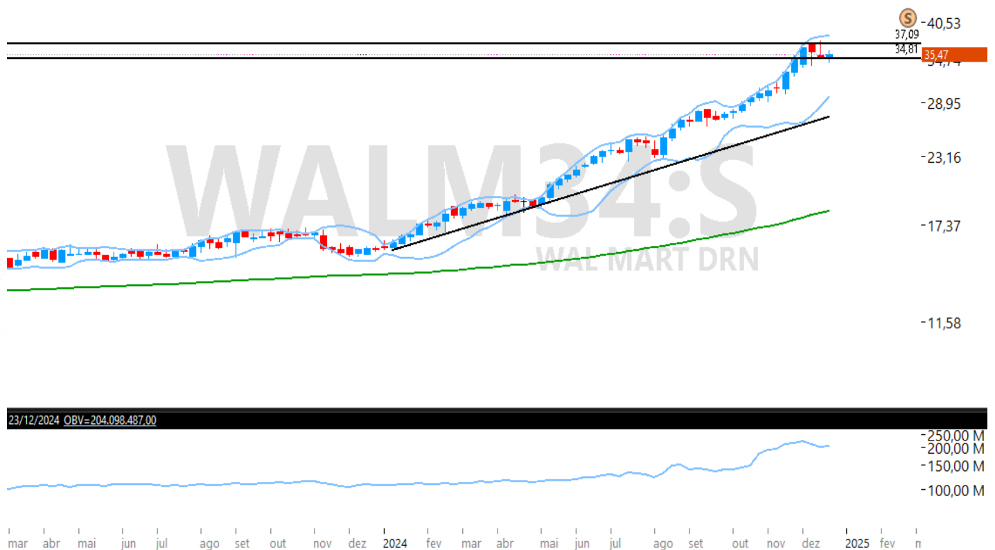
Figura – Gráfico semanal de WALM34