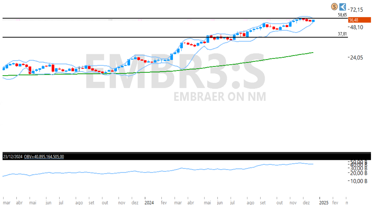
Figura – Gráfico semanal de EMBR3