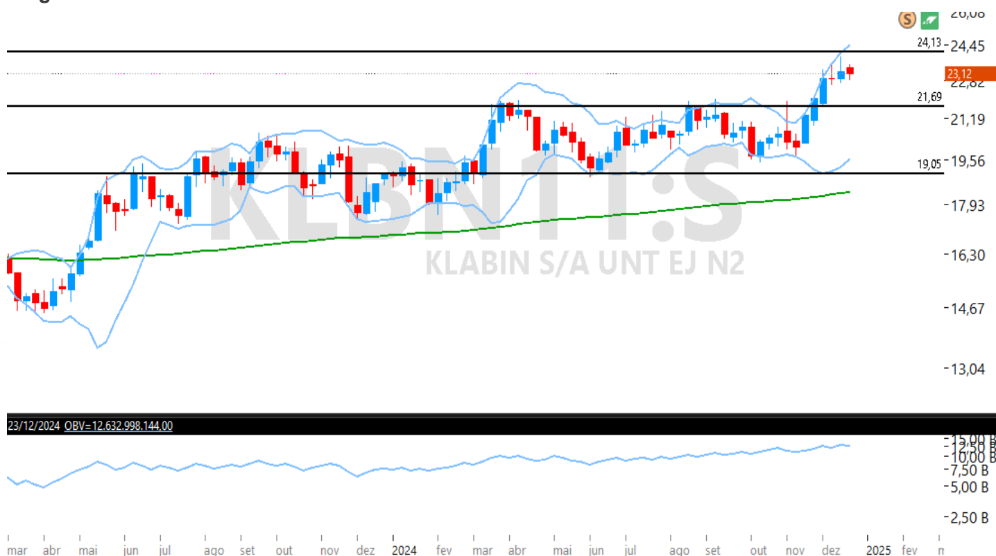
Figura – Gráfico semanal de KLBN11