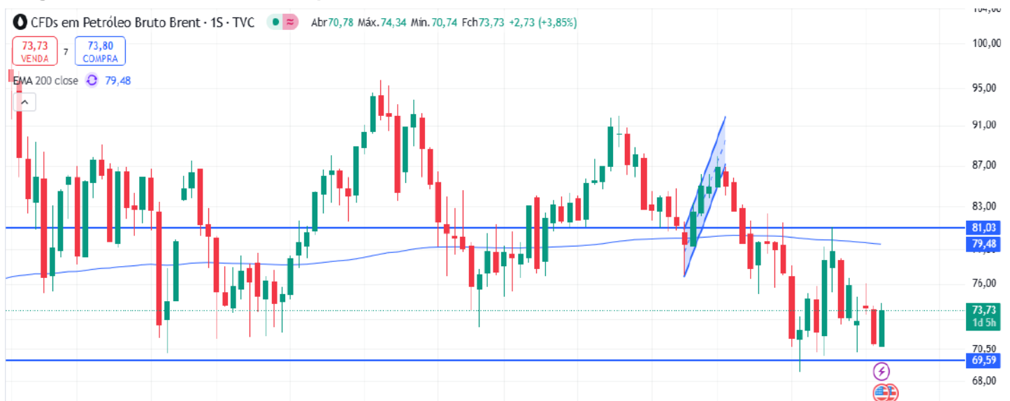
Figura 5 – Gráfico semanal do petróleo Brent