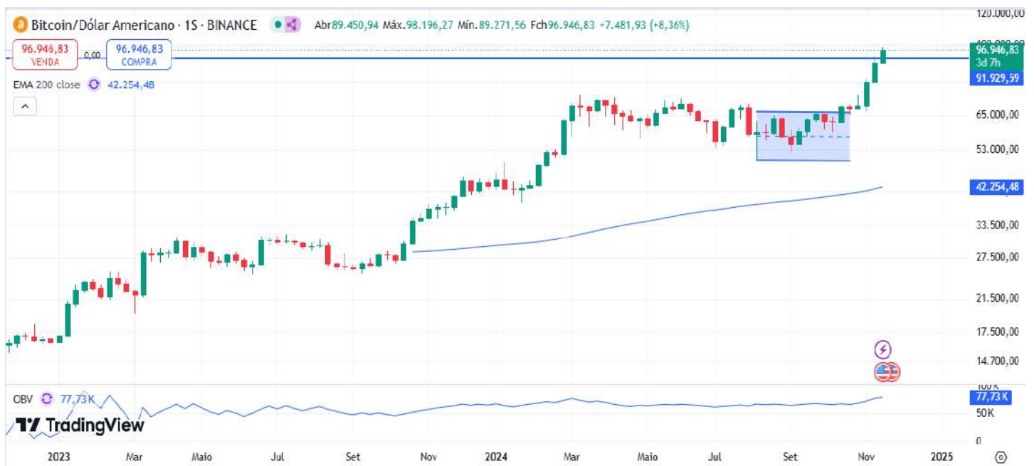
Figura 7 – Gráfico semanal do Bitcoin