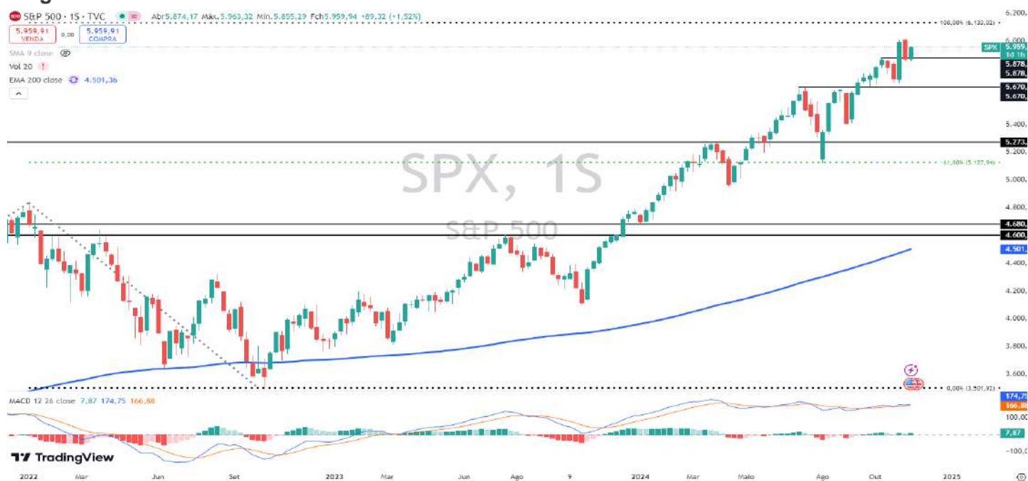
Figura 3 – Gráfico semanal do S&P