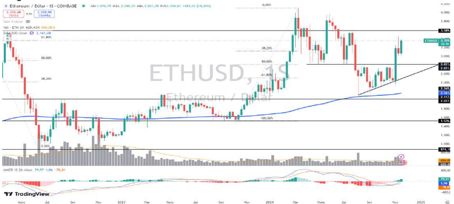
Figura 8 – Gráfico semanal da Ethereum