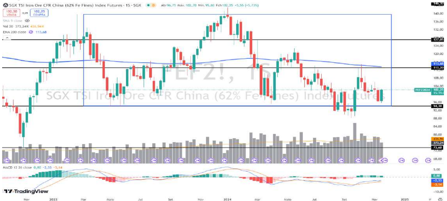
Figura 6 – Gráfico semanal do minério de ferro