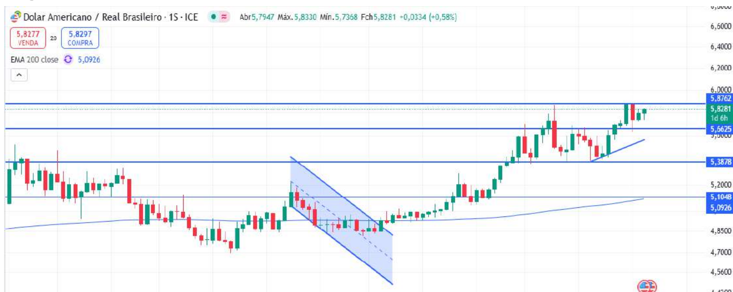
Figura 2 – Gráfico semanal do dólar