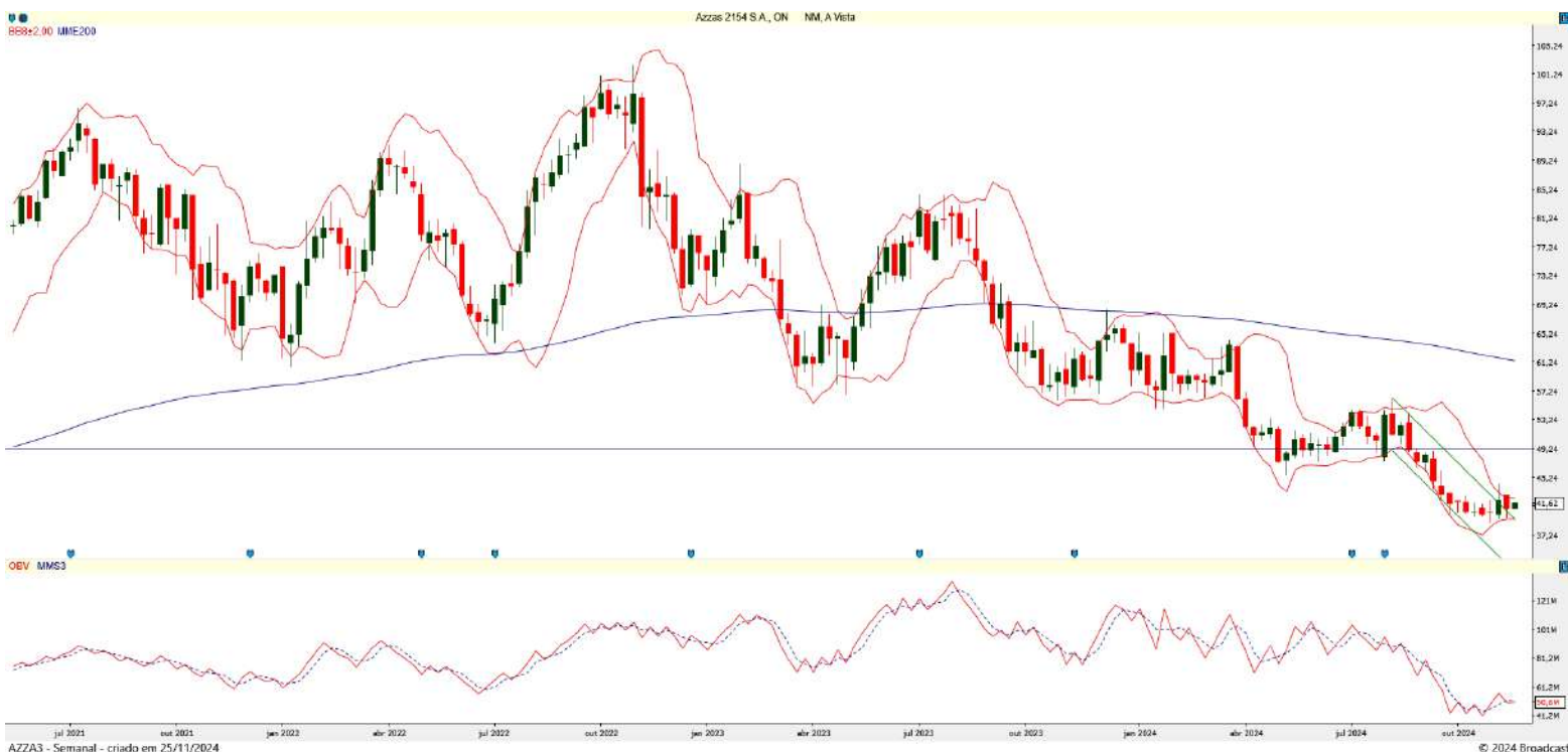
Gráfico 2 – Gráfico semanal de AZZA3