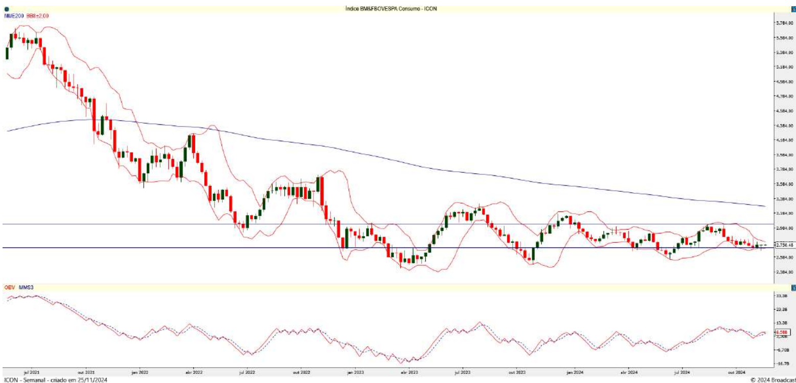
Gráfico 1 – Gráfico semanal do ICON