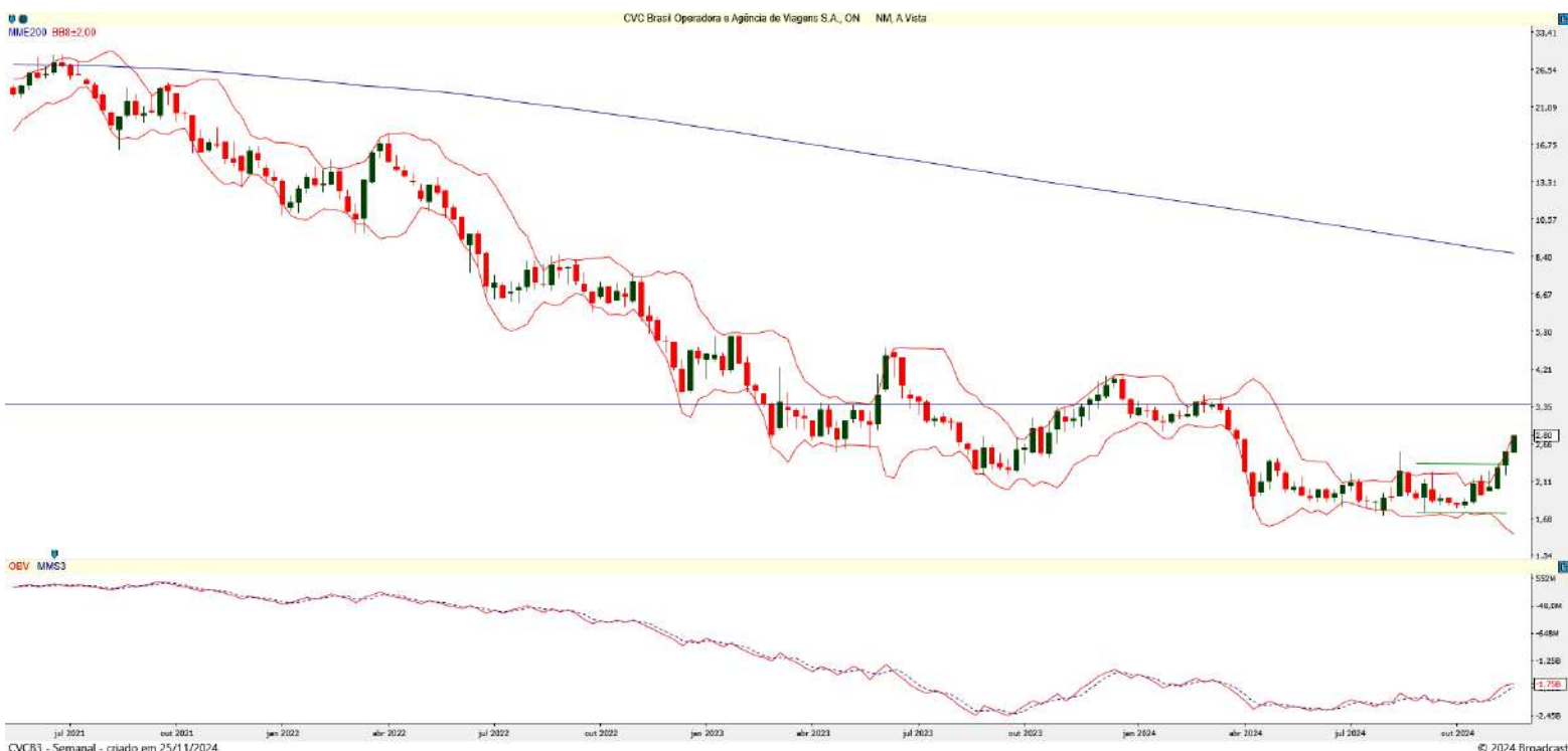
Gráfico 3 – Gráfico semanal de CVCB3