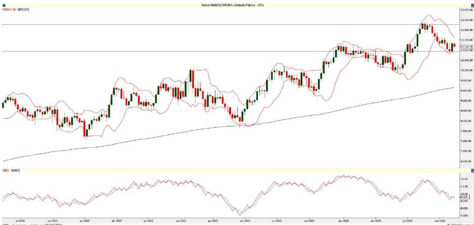
Gráfico 1 – Gráfico semanal do UTIL