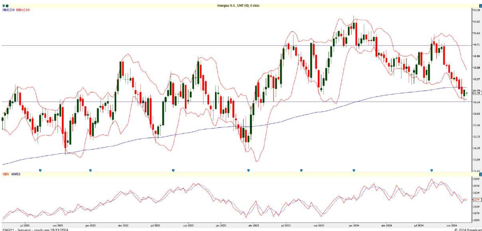
Gráfico 3 – Gráfico semanal de ENGI11