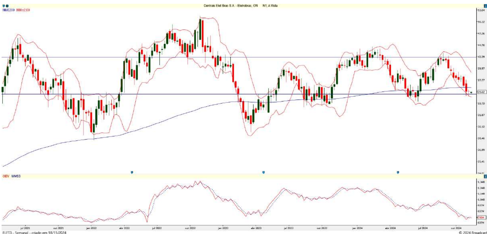
Gráfico 2 – Gráfico semanal de ELET3