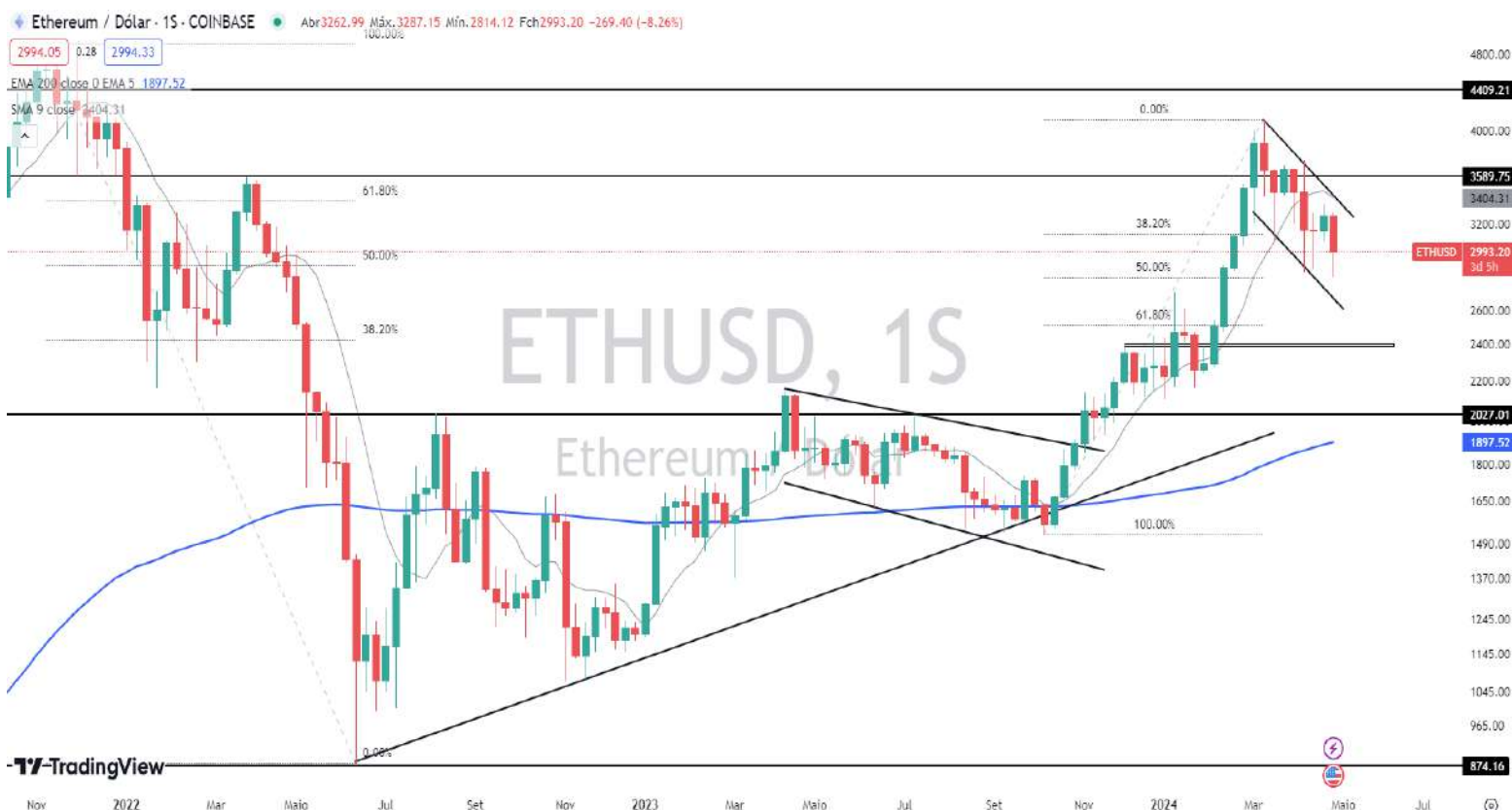
Gráfico 8 – Gráfico semanal da Ethereum

Sinalizou correção em região de resistência