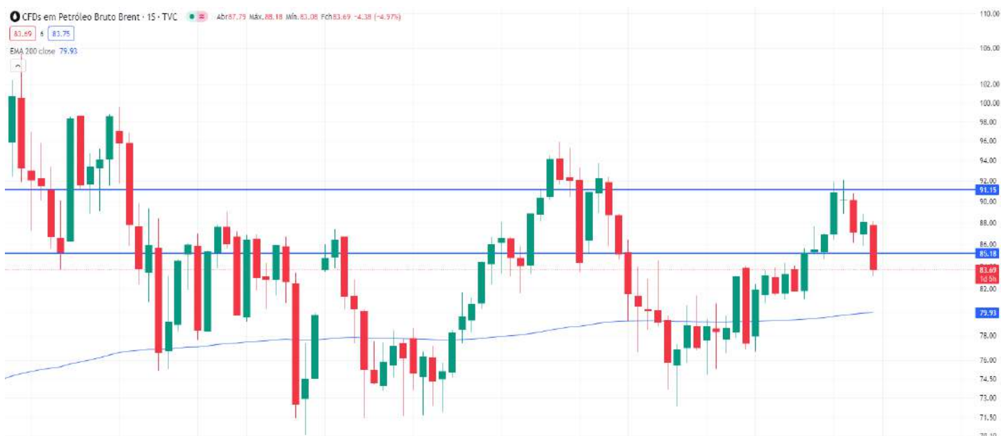
Gráfico 5 – Gráfico semanal do petróleo Brent