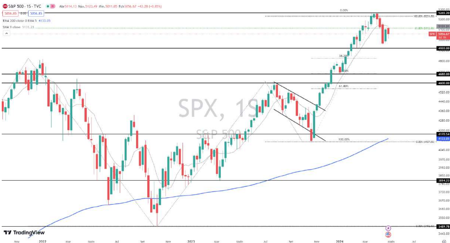
Gráfico 3 – Gráfico semanal do S&P

Interrupção do rali de alta; sinais de correção no mercado