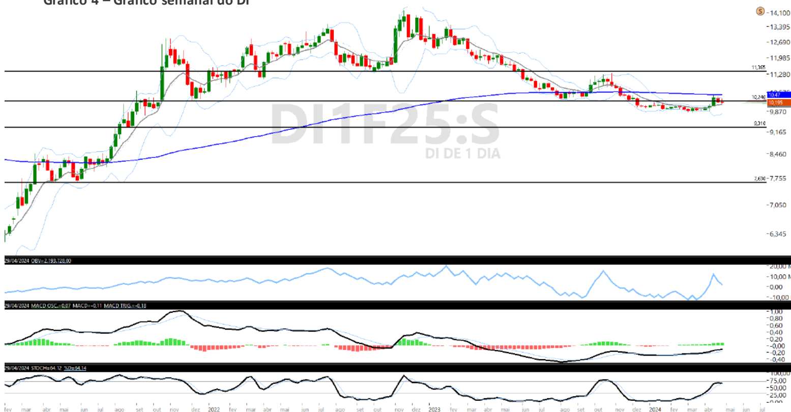
Gráfico 4 – Gráfico semanal do DI