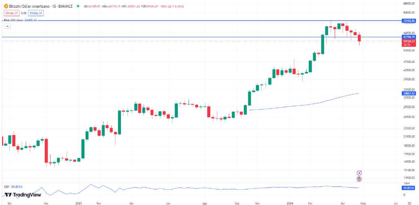
Gráfico 7 – Gráfico semanal do Bitcoin