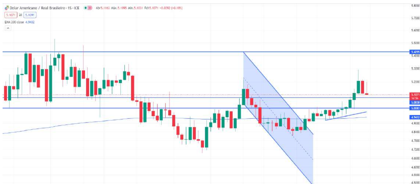
Gráfico 2 – Gráfico semanal do dólar