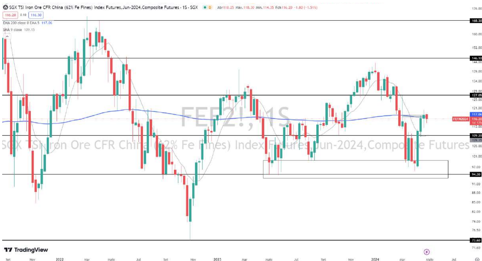
Gráfico 6 – Gráfico semanal do minério de ferro

Consolidação em curso; na média de 200 períodos