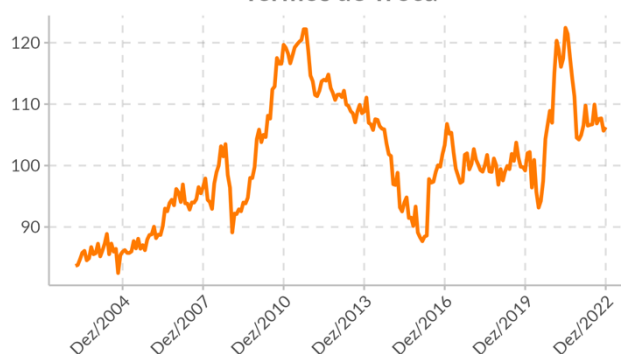
Termos de Troca

A partir do aumento no nível de exportações, refletindo a conjuntura favorável para petróleo e grãos, e uma conjuntura menos favorável para as importações, tendo em vista a desaceleração da atividade interna e os debates quanto a imposição de taxas a pequenas mercadorias, esperamos uma apreciação nos termos de troca brasileiros.