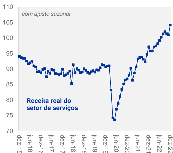
Após duas quedas consecutivas, a receita real do setor de serviços subiu 3,1% em dezembro...