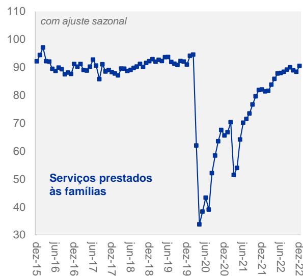
...enquanto os serviços prestados às famílias cresceram 2,4%