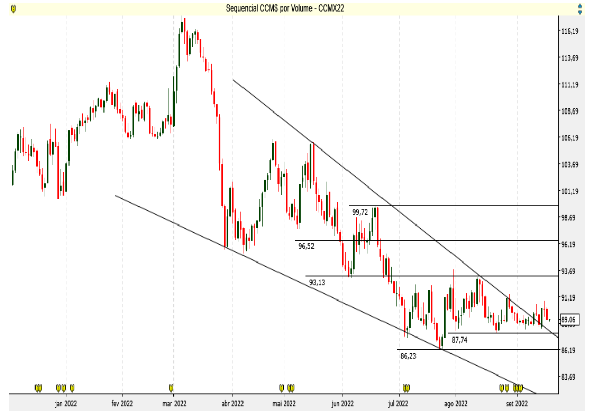
CCM$ - Diário - criado em 20/09/2022

O Milho BM&F segue perto dos suportes, ainda sem pressão na compra.