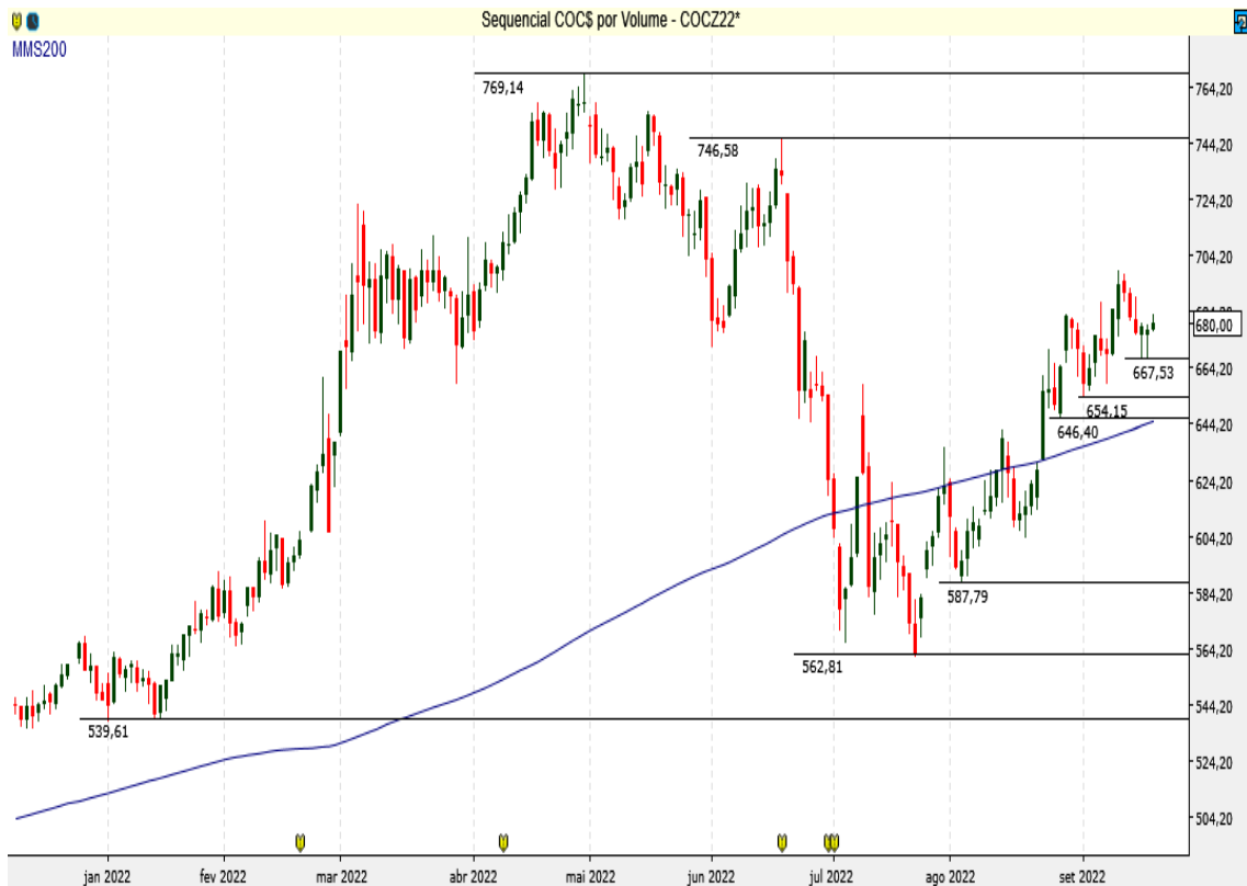
COC$ - Diário - criado em 20/09/2022

O Milho Chicago supera regiões de resistências.