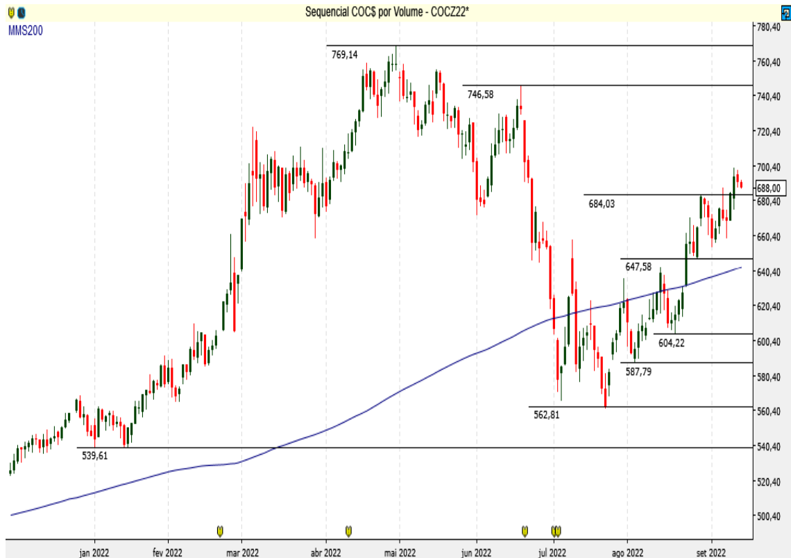
COC$ - Diário - criado em 14/09/2022

O Milho Chicago supera regiões de resistências.