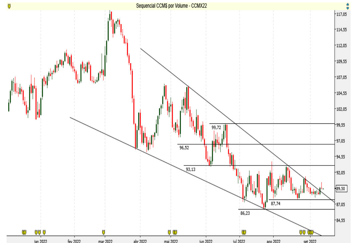
CCM$ - Diário - criado em 14/09/2022

O Milho BM&F supera a resistência da Cunha e pode mostrar recuperação.