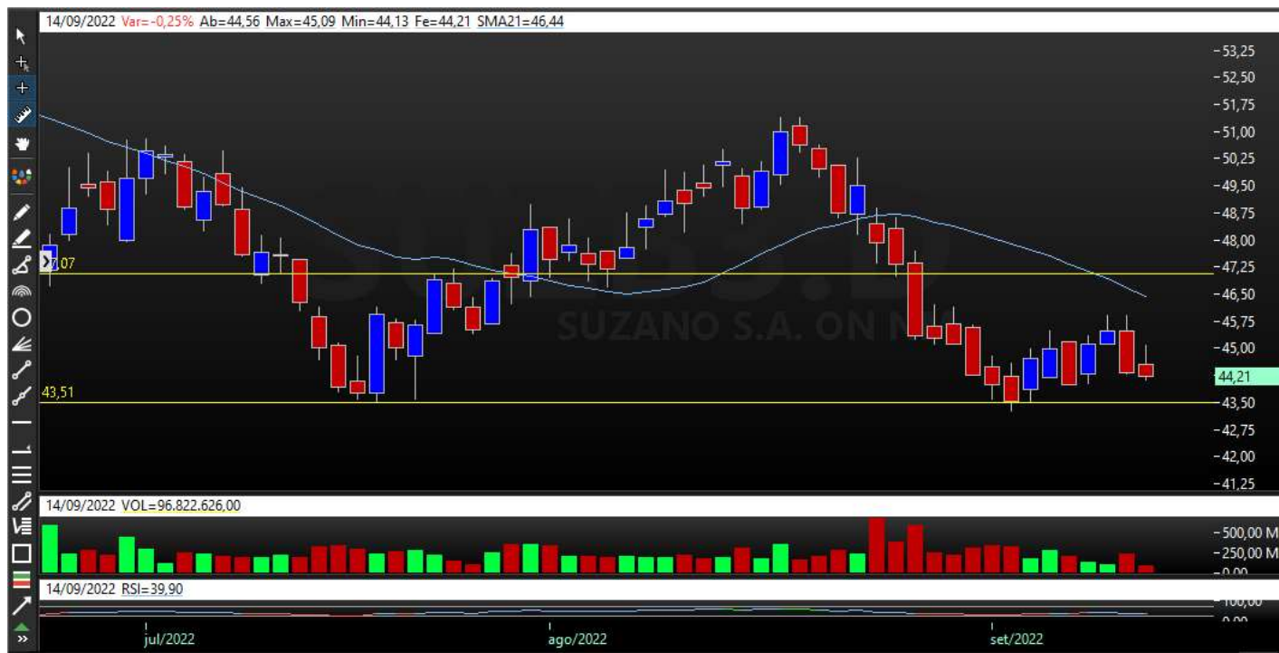
Gráfico Semanal – Tendência de Baixa