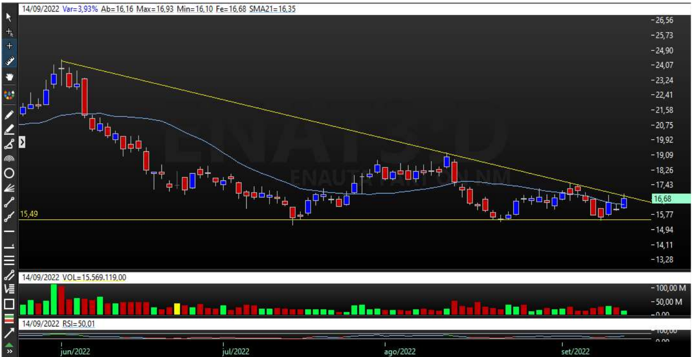
Gráfico Semanal – Tendência Indefinida