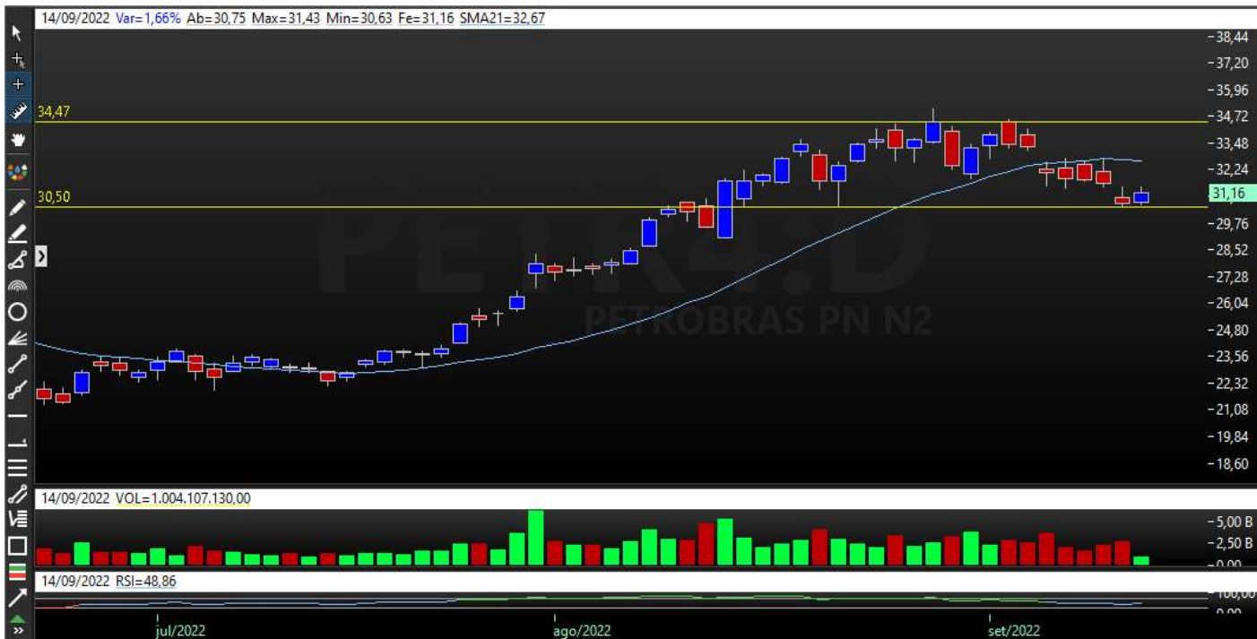
Gráfico Semanal – Tendência de Alta