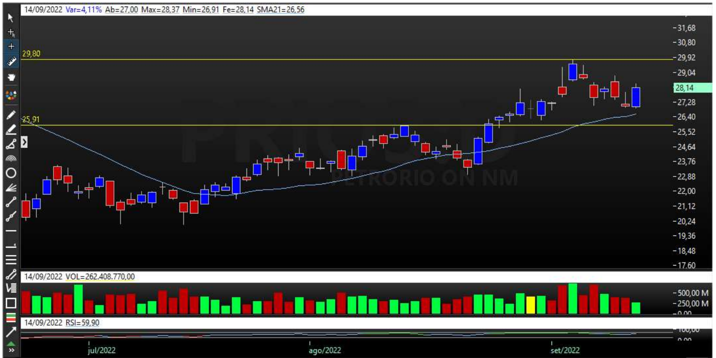
Gráfico Semanal – Tendência Indefinida