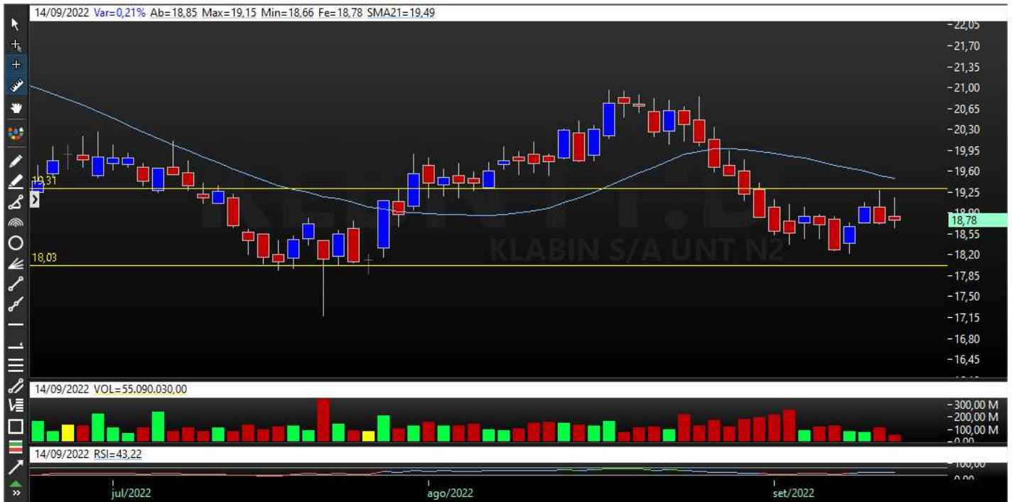
Gráfico Semanal – Tendência de Baixa