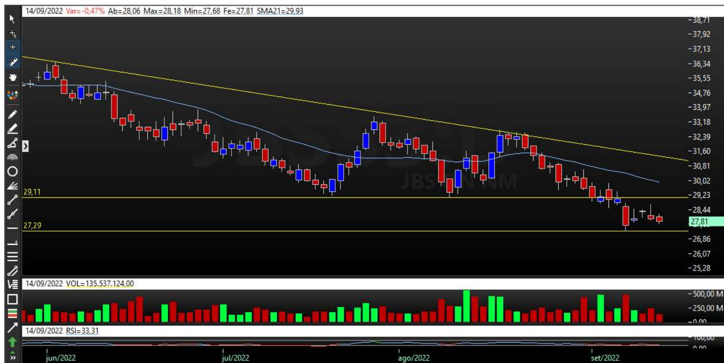
Gráfico Semanal – Tendência de Baixa