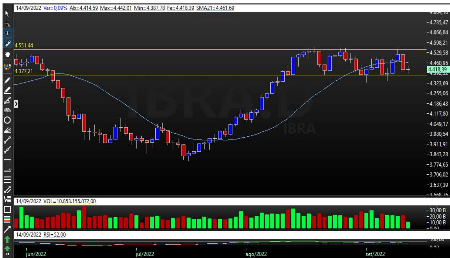
Gráfico Diário – Tendência de Alta

Atendimento: 0800 770 9936 atendimento@necton.com.br