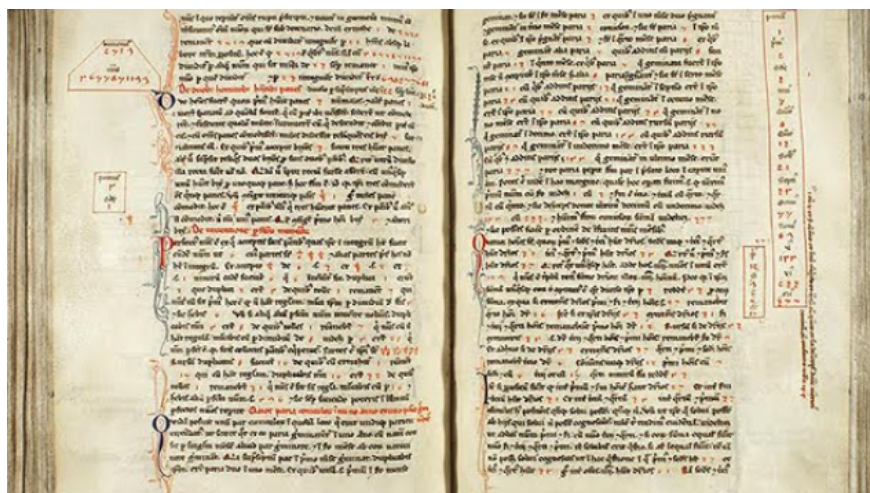
Liber Abaci de Leonardo Pisano - Fibonacci

Para fechar este papo inicial: dados e jogos muito contribuíram para o estudo de probabilidade, essencial para quantificar risco. Nomes como Bernoulli, Pascal, Fermat e Cardano foram importantíssimos nesse processo – e, antes deles, houve um que proporcionou um salto quântico na matemática europeia, até então atrasadíssima: Leonardo Pisano, que entrou para a história da matemática conhecido como Fibonacci (1170 - 1250). O italiano é considerado o mais talentoso matemático da Idade Média. Com o livro Liber Abaci (de 1202), introduziu na Europa os algarismos indo-arábicos, usados até hoje, em substituição aos algoritmos romanos (impraticáveis para qualquer forma de matemática mais sofisticada que a pura e simples contagem, desde que não vá muito longe). Para saber mais, Desafio aos Deuses proporcionará um incrível conhecimento sobre a origem da matemática e da probabilidade e uma infinidade de informações com as quais, a meu ver, o leitor vai se deleitar.