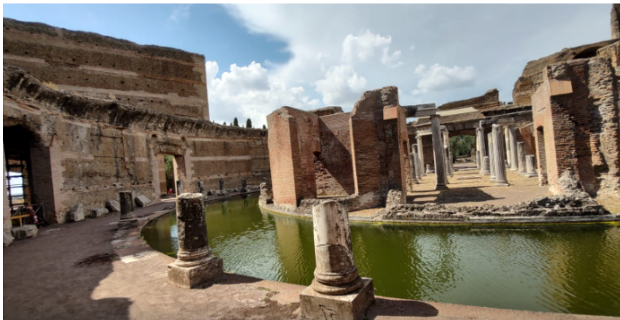
Vila Adriana – local onde o Imperador Adriano se isolava circundado por um fosso para não ser perturbado.

Ficamos alguns dias em Atenas, com um ligeiro bate-e-volta em Delfos, complementados com dois cruzeiros a diversas ilhas – são mais de 2 mil no arquipélago, no mar Jônico (passando pelo canal de Corinto) e nas Cíclades (no mar Egeu). Fizemos uma boa dúzia de visitas – incluindo, na Itália, além de Roma, locais como a Vila Adriana, em Tívoli – local em que, no século 2 (76 – 138 d.C.), abrigou um complexo palaciano para o imperador Adriano. Originalmente, cobria 120 hectares; hoje, há 40 hectares ainda com remanescentes em pé. Tudo isso acompanhado de guias profissionais, com grande formação em história e arqueologia. Na Grécia, a formação de um guia turístico dura três anos – e posso dizer em primeira mão, mais que visitas guiadas, tivemos verdadeiras aulas. Voltamos com uma rica bagagem de conhecimento, além das lembranças do deleite para os olhos que são aqueles locais únicos.