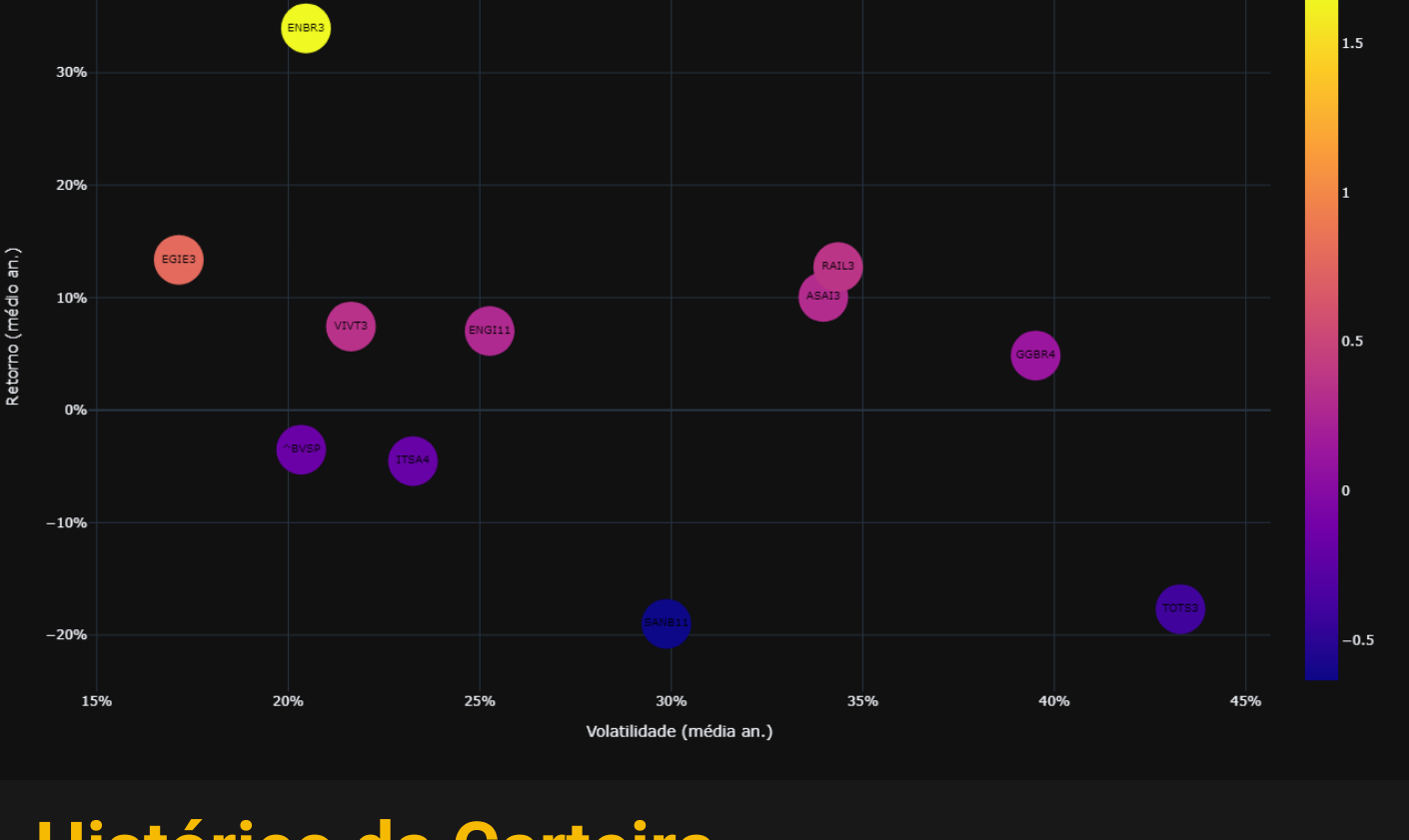
Gráfico Risco Retorno de Carteira: Quanto mais alto, Maior o retorno. O risco é medido da esquerda para direita. Quanto mais posicionado a direita, maior é sua volatilidade.