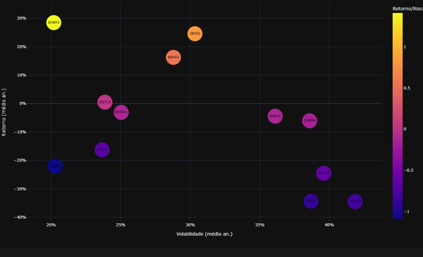
Gráfico Risco Retorno de Carteira: Quanto mais alto, Maior o retorno. O risco é medido da esquerda para direita. Quanto mais posicionado a direita, maior é sua volatilidade.