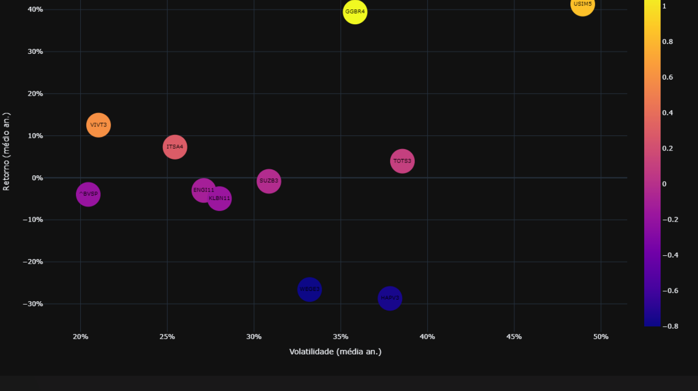
Gráfico Risco Retorno de Carteira: Quanto mais alto, Maior o retorno. O risco é medido da esquerda para direita. Quanto mais posicionado a direita, maior é sua volatilidade.