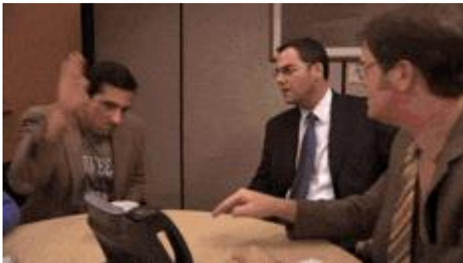
Investidor BR após decisão do FED

U.S. 10Y Treasury 1.83% (-1,71%) (Mercado 24h)