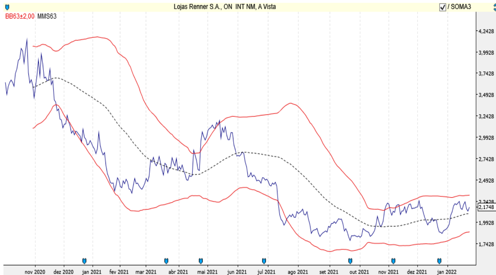
Gráfico *Ratio: LJS RENNER ON (LREN3) / SOMA ON (SOMA3)

* Ratio: é a divisão do valor da ação comprada pelo da ação vendida.