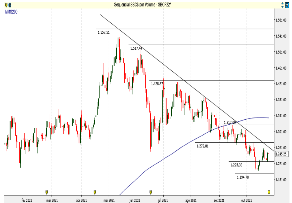
SBC$ - Diário - criado em 26/10/2021

A Soja continua abaixo da Linha de Tendência de Baixa (LTB).