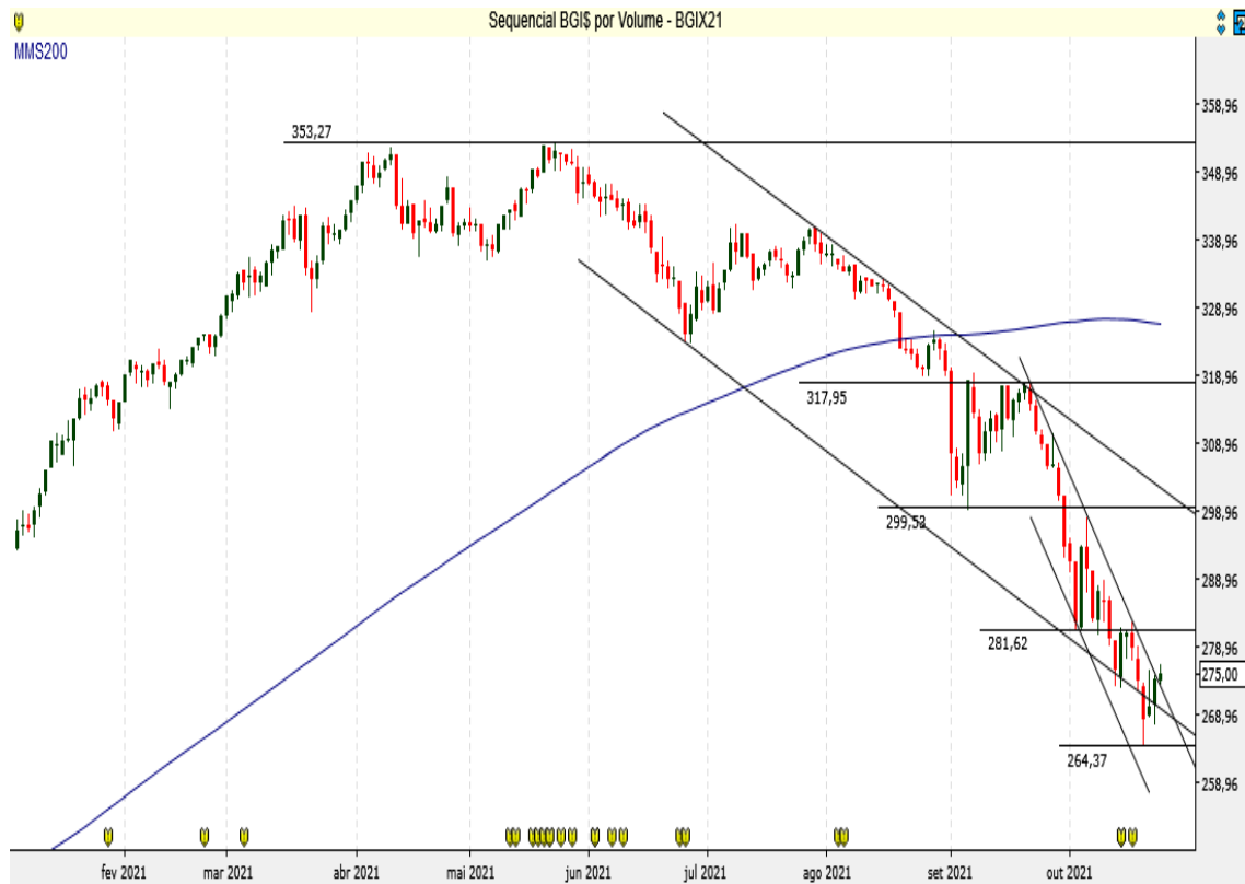
BGI$ - Diário - criado em 26/10/2021

O contrato futuro de Boi Gordo mantém o movimento de baixa.