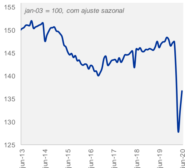
PM-Itaú avança em maio e junho, mas segue abaixo do nível pré-crise

O resultado reflete o crescimento disseminado na indústria, varejo ampliado 1 e no setor de serviços. De acordo com IBGE, os crescimentos mensais para estes setores em junho foram, respectivamente, de 8,9%, 12,6% e 5,0% (com ajuste sazonal).